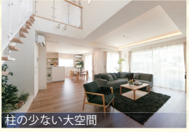
柱の少ない大空間 しっかりした骨組みによりひろびろとした大空間を実現