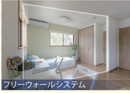
フリーウォールシステム 将来の間取り変更にも柔軟に対応できます