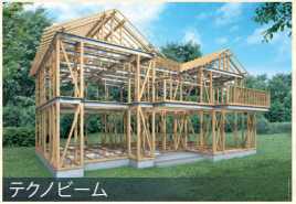
テクノビーム 木と鉄の複合梁「テクノビーム」で木造住宅を強化